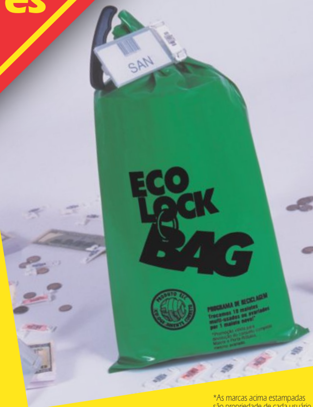
Malote Ecolock com porta-rótulo