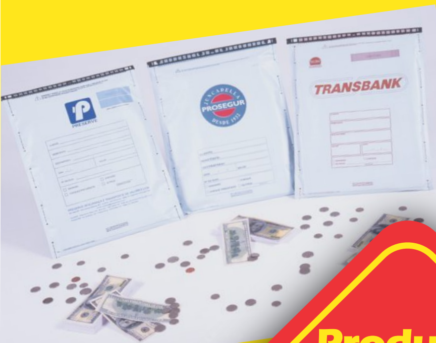
Malotes descartáveis Starlock