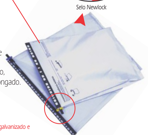
Arquivo Modular Starlock Plus*