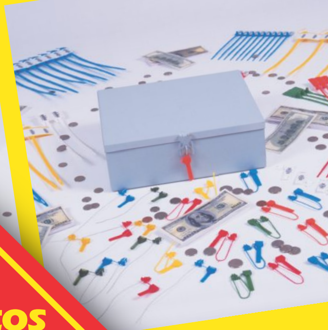
Lacres Tik AFN/AWN